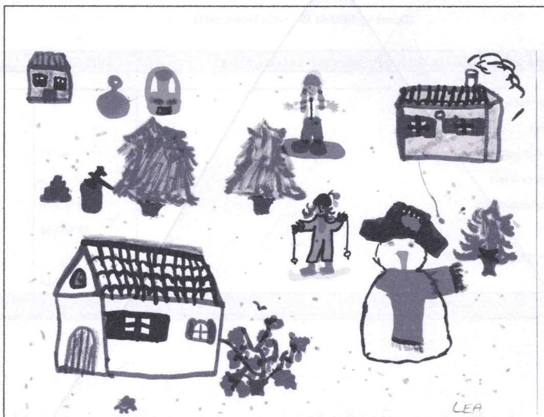
Dessin réalisé par Léa Germain . " neige à L'Epine"